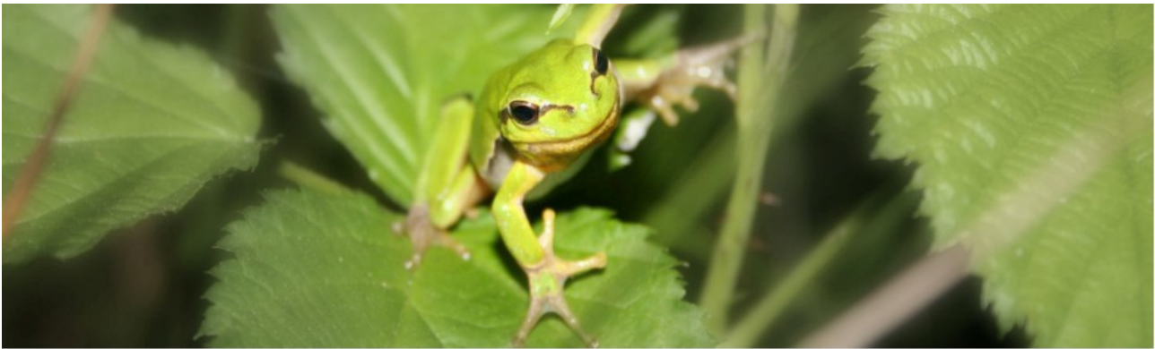
HYLA, de amfibieën- en reptielenwerkgroep van Natuurpunt