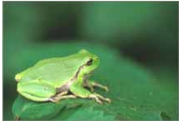
Fig. 3. Boomkikker ( Hyla arborea )

De geruchten waren er al langer en in 2005 werd het ontbreken van de bekende geluiden bevestigd door verschillende personen en na een hele resem van nachtelijke bezoeken in het veld. Onze Boomkikker ( Hyla arborea ) (fig. 3) roept niet meer vanuit de vijvers in de Maten te Genk. Hiermee is België alweer een populatie van dit kleine struikrovertje armer. Van slechts vijf naar nog slechts vier vindplaatsen. Een hele rits van theorieën steken de kop op van hoe het allemaal zover is kunnen komen. Gaande van teveel aan vis in de vijvers, volledig 'weg gegraven' populaties, ontbreken van voldoende optimaal landbiotoop, wegvangen van dieren, inteelt, virussen, overschatting in het verleden tot predatie door groene kikkers en vogels. Waarschijnlijk is het een combinatie van een hele hoop negatieve factoren. Het is ook niet ongewoon dat populaties lokaal plots verdwijnen om nadien opnieuw aangevuld te worden door individuen uit naburige populaties. Het enige spijtige detail is dat de populatie in de Maten geïsoleerd is van de dichtstbijzijnde populatie door het Albert-Kanaal.