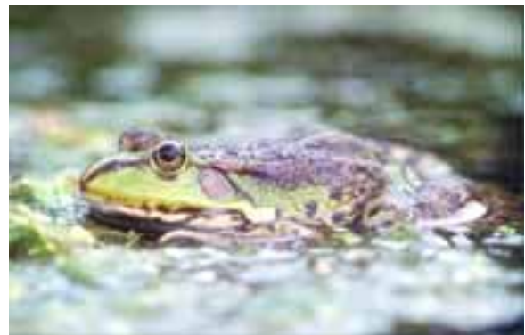
Fig. 2. Meerkikker ( Rana ridibunda )

Meer het binnenland in worden geen Meerkikkers meer aangetroffen. Het Albertkanaal, de Zuid-Willems-Vaart en de N78 vormen een voorlopige barrière.