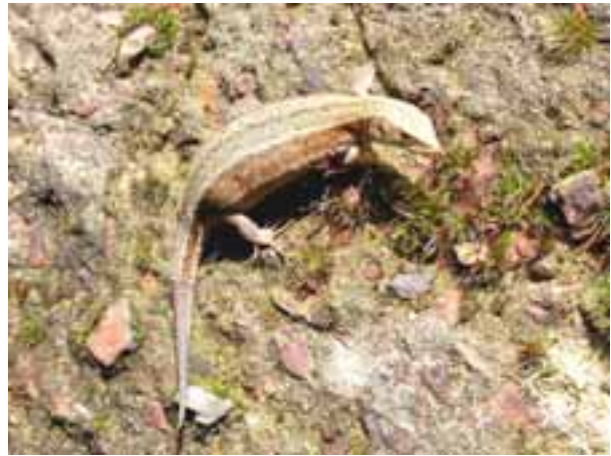
Fig. 1. Levendbarende hagedis ( Zootoca vivipara )

In het kader van het lopend Atlas-project bezochten Ward Machielsens, Yves Lesseliers en ikzelf begin juni de heidegebieden en wastines te Mol-Postel. In het vengebied op de Koemook waren we getuige van een niet alledaags verschijnsel. Een Levendbarende hagedis ( Zootoca vivipara ) vluchtte plotseling over een Pijpenstrootjes pol voor onze voeten weg, zwom vervolgens enkele cm op het wateroppervlak van een klein vennetje om plotseling onder te duiken en zich te verschuilen op de bodem van het water. Dit niet alledaags gedrag werd in het verleden reeds geobserveerd in een beekje in een oude groeve te Winterswijk (NL) waar een vluchtende hagedis wel 10 minuten lang onder water bleef (Zekhuis, 204). Mochten er nog andere personen zijn die reeds een dergelijk gedrag bij de Levendbarende hagedis of andere reptielen waargenomen hebben dan is alle informatie hierover welkom.